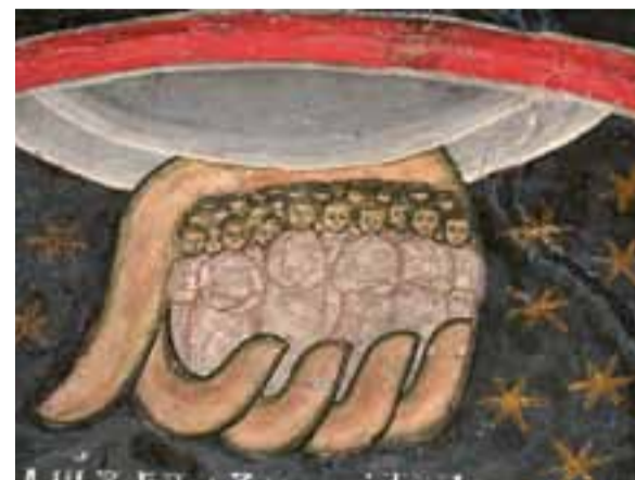
Души праведных в руке Божией. Фреска

Преподобному Силуану Афонскому была открыта такая «формула»: держи свой ум во аде и не отчаивайся. Мы можем сомневаться в своем спасении, но надеяться на него, а о том, что касается спасения других людей, апостол Павел прямо пишет в Послании к Коринфянам: Посему не судите никак прежде времени, пока не