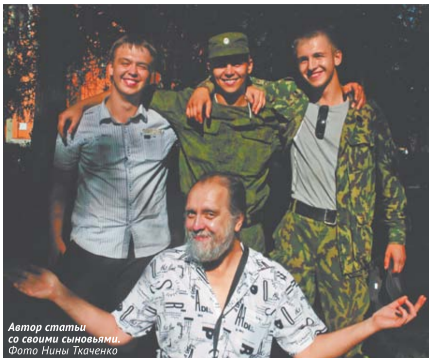
Автор статьи со своими сыновьями.

Тут нужно сделать некоторое пояснение. Я много раз видел, как в семьях моих знакомых подросткам за праздничным столом взрослые наливают бокал шампанского или рюмку вина. Мол, все равно будут пить, так пускай уж лучше в кругу семьи формируют «культуру питья», под зорким присмотром хмелеющих родителей. Мне такая практика не нравилась категорически, я считал и продолжаю считать, что она лишь снимает очередной запрет (которых у нынешних детей и так немного) и формирует у детей никакую не «культуру», а зачатки алкоголизма. Поэтому, когда однажды во время семейного застолья услышал от детей реплику в стиле «А почему нам нельзя даже шампанского? У Вовчика вон папа и коньяк разрешает по чуть-чуть», ответил не по-праздничному конкретно и доходчиво. В том смысле, что, даже когда им будет по тридцать лет, я все равно не позволю им пить в моем доме. А ежели узнаю, что Вовчиков папа наливал им что-нибудь крепче лимонада, то буду иметь с ним очень серьезный разговор.